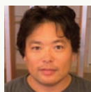
五十嵐太郎 建築史・建築批評家 Taro Igarashi Architectural Critic/ Architectural Historian