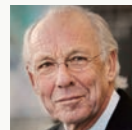
ヨルゲン・ランダース BIノルウェービジネススクール 名誉教授 Jorgen Randers Professor Emeritus, BI Norwegian Business School