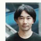
和田永 アーティスト/ミュージシャン Ei Wada Artist/Musician