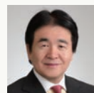
竹中平蔵 東洋大学教授 Heizo Takenaka Professor, Toyo University