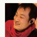
尾原和啓 執筆・IT批評家 Kazuhiro Obara Futurist