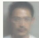
豊田啓介 建築家 Keisuke Toyoda Architect